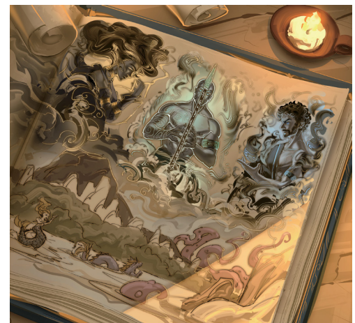
Illustrations (non définitive) du verso de la couverture :