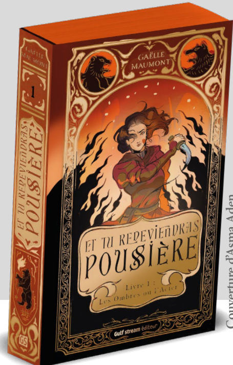
Couverture d'Asma Aden

Trop tard. Nyx est arrivée trop tard. Sorcière capable de plier les ombres à sa volonté, elle n'a rien pu faire pour sauver les siens. Les Shamaanis ont été tués par des mercenaires aux ordres du roi Adalin, souverain de Fortmartel, dont l'esprit a sombré dans la folie depuis l'apparition des cendres. Seule survivante, accompagnée de son loup blanc Orion, Nyx fait le serment de se venger. Tous ceux qui ont participé à ce carnage mourront. Et ce serment ne sera pleinement accompli qu'avec l'exécution du roi... et de son fils, le prince Rowann. Celui-là même qui s'est servi de ses sentiments pour mieux la trahir. Mais Nyx ignore que Rowann a été emprisonné par son propre père depuis le jour du massacre. Elle ignore aussi que les cendres cachent des secrets plus anciens, plus dangereux encore. Aveuglée par sa soif de vengeance, la jeune sorcière pourrait bien passer à côté des sombres desseins de la famille royale... et de la vérité qui menace de tout engloutir.