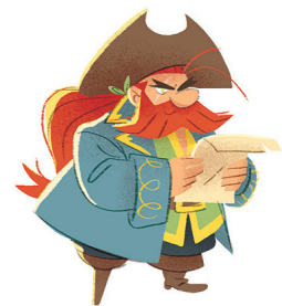
BOB LE BOITEUX