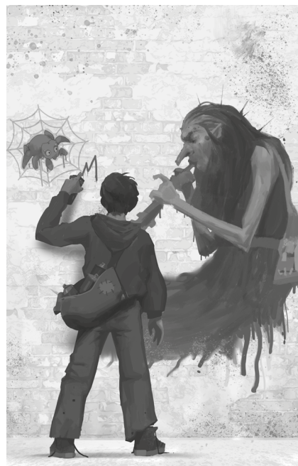
Cabochoch + illustration intérieure

À l'aise dans des genres aussi différents que le polar historique, le récit intimiste, le thriller ou la fantasy, scénariste de bandes dessinées, Charlotte BOUSQUET (49) a écrit plus d'une quarantaine d'ouvrages, souvent primés. Chez Gulf stream éditeur, elle est l'autrice des Graphiques cycles collège et lycée, de la trilogie fantastique Les Enfants des Saules, de À cœurs battants (collection Échos) et de trois romans pour les jeunes adultes dans la collection Électrogène (Là où tombent les anges, fresque historique saluée par la critique, Sang-de-lune, roman dystopique sélectionné pour le prix Imaginales des lycéens 2017 et enfin Celle qui venait des plaines).