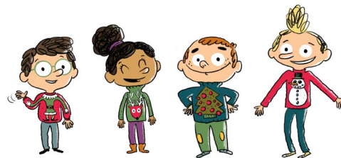
Les enquêteurs du slip (par Loïc Méhée)