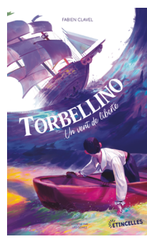
Torbellino, Gulf stream éditeur, 2022