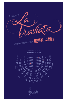
D'après La Traviata, Gulf stream éditeur, 2022