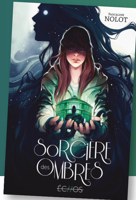
Illustration de couverture par Jessica Heran.