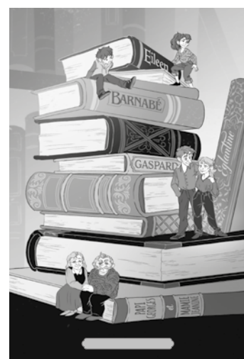
La famille Glacé, héros des Papiliers Illustration intérieure

Sur les étagères oubliées de la librairie Chez Willy on lit , au cœur des ouvrages anciens, vivent des Petits Êtres Cachés, les Papiliers. Leur quotidien est bouleversé lorsqu'un humain, Tony, achète un livre dans lequel dort le jeune Barnabé. Bravant les mille dangers du monde extérieur pour le retrouver, sa famille reçoit une aide inattendue dans leur quête. Au même moment, le garçon découvre que Tony n'est autre que le chef d'une bande de cambrioleurs. Or, le mauvais coup qu'il prépare met en péril toute la cité souterraine des Petits Êtres Cachés. Barnabé n'a plus qu'un seul objectif : rejoindre les siens avant qu'il ne soit trop tard.