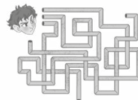
Cabochons des entrées de chapitres

Lenia MAJOR (67) est l'autrice de plus d'une centaine de livres pour la jeunesse : des séries de romans fantasy, des romans ados, young adult, ou pour les plus jeunes, et des albums illustrés. Ils sont traduits en une dizaine de langues. Elle défend dans la vie et par la plume la cause animale, comme avec le multiprimé Caballero . Ses héros attachants et les univers riches qu'elle nous dépeint font d'elle une fantastique raconteuse d'histoires... qui se terminent bien, de préférence !