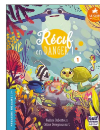
1. Récif en danger !