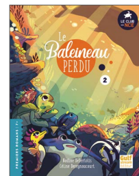
2. Le Baleineau perdu