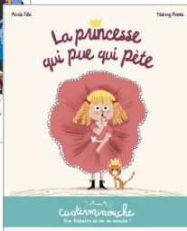
La Princesse qui pue qui pète, Casterman (2020)