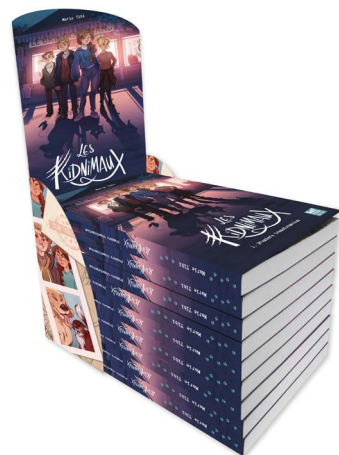
Stop-pile Les Kidnimaux