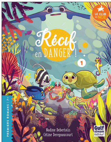
TOME 1 : RÉCIF EN DANGER !