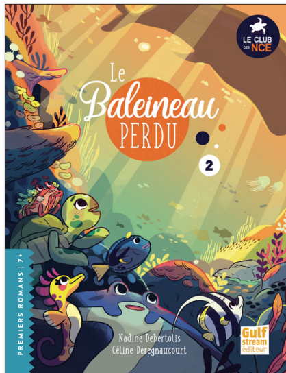
TOME 2 : LE BALEINEAU PERDU

Couverture et illustrations intérieures : Céline Deregnacourt Direction artistique : Tiphaine Rautureau Typographies : Aliseo – RC graphics ; Shaped Fonts – Philip Trautmann ; Arabella – MySunday Type Foundry ; Caviar Dreams – Lauren Thompson