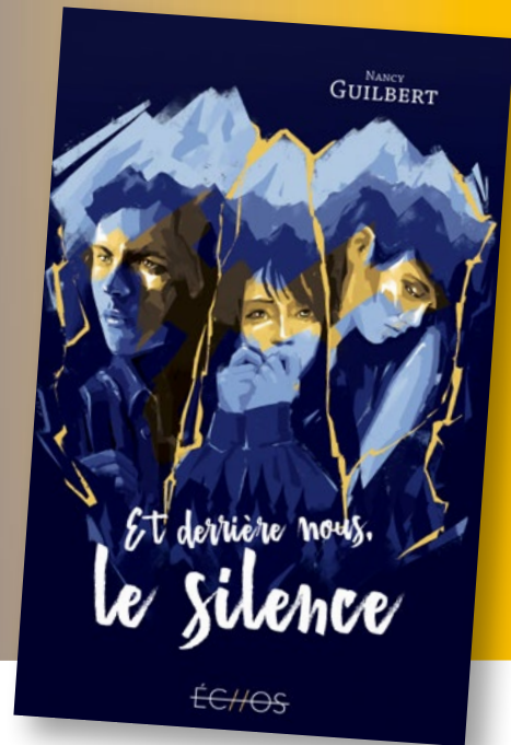
Illustration de couverture par Leselo Quentès.