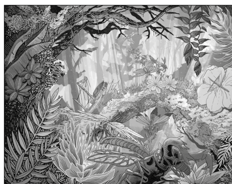
Illustration présente à l'intérieur du tome 3