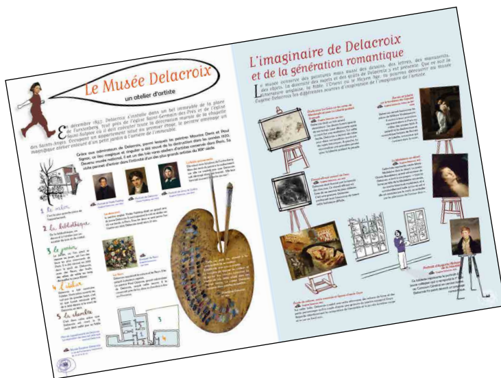
Double page intérieure